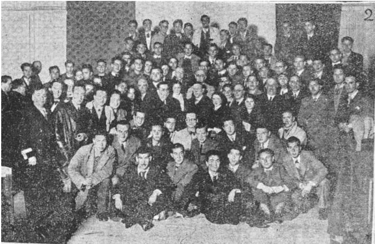
Figura 2. Foto de grupo realizada por Villar y Kasado que apareció en Ideal Gallego el 29 de abril de 1934. En ella aparecen los profesores y alumnos de la Facultad de Medicina y los asistentes a la conferencia del profesor Egas Moniz. "El Ideal Gallego", Año XVIII Número 4245 - 29 de abril de 1934.